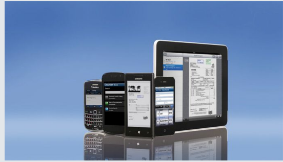
DocuWare Mobile lässt sich von zahlreichen mobilen Geräten nutzen, etwa iPhone, iPad, Blackberry, Tablets oder Smartphones mit Android bzw. Windows Phone 7 sowie Tablets mit Windows 8

In DocuWare Mobile können Sie sogar auch Listen mit Aufgaben verwenden. Dabei sammelt DocuWare die zu bearbeitenden Dokumente und zeigt diese in einer Liste an. Dahinter steht eine automatische Suche mit festgelegten Index-Kriterien. Sobald die Aufgabe – etwa die Freigabe einer Rechnung – erledigt ist, verschwindet der Eintrag aus der Liste und das Dokument wandert weiter in die Liste des nächsten zuständigen Mitarbeiters.