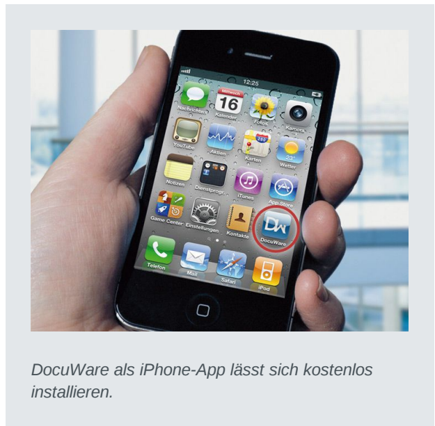
DocuWare als iPhone-App lässt sich kostenlos installieren.

DocuWare Mobile lässt sich mit zahlreichen mobilen Geräten nutzen, so etwa mit dem iPhone, iPad, iPod, auf Blackberry-Smartphones, auf Geräten mit Windows Phone 7 und Android sowie Tablets mit Windows 8. Der Funktionsumfang kann sich je nach Gerät und Betriebssystem leicht unterscheiden. Bei den mobilen Geräten von Apple haben Sie die Wahl, ob Sie auf das Dokumentenmanagement über die App DocuWare Mobile zugreifen oder über einen HTML-5-fähigen Browser wie Safari. Die Installation entfällt beim Browserzugang, jedoch kann die App in der Regel schneller arbeiten als dies per Browser möglich ist. Für Blackberry- und Android-Geräte ist nur der Browser-Zugang verfügbar; Smartphones mit Windows Phone 7 sowie Tablets mit Windows 8 arbeiten nur mit der App. Mehr Informationen zu Versionen und Funktionen finden Sie unten im Kasten „10 Fragen“ sowie im DocuWare Knowledgecenter unter help.docuware.com/de/#t56052